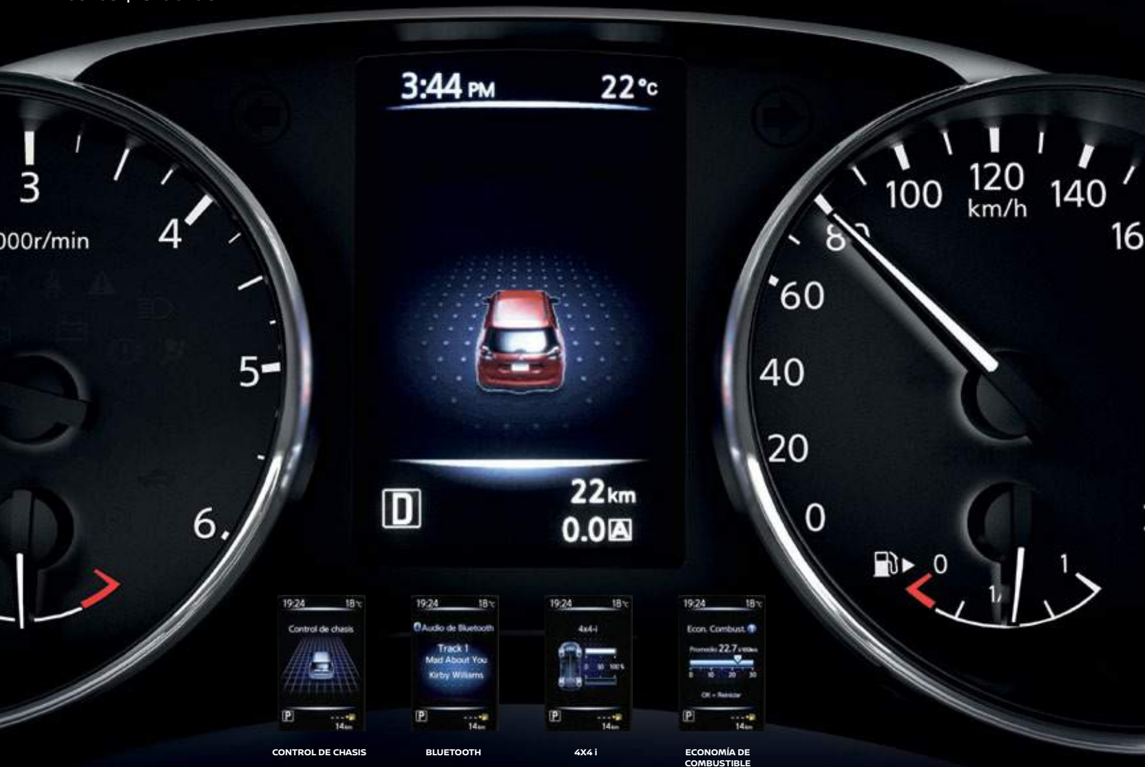
CONTROL DE CHASIS

Toda la información frente a tus ojos en el Nissan Advanced Drive Assist Display para el conductor en una pantalla a color de 5". Usa los controles al volante para navegar entre las diferentes pantallas, sólo se necesita un clic en las flechas. ¡Así de fácil!