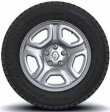
Rines 16" de lámina