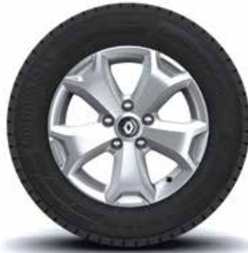
Rin 16" Aluminio