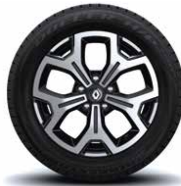
Rin 17" Aluminio - Diamantados