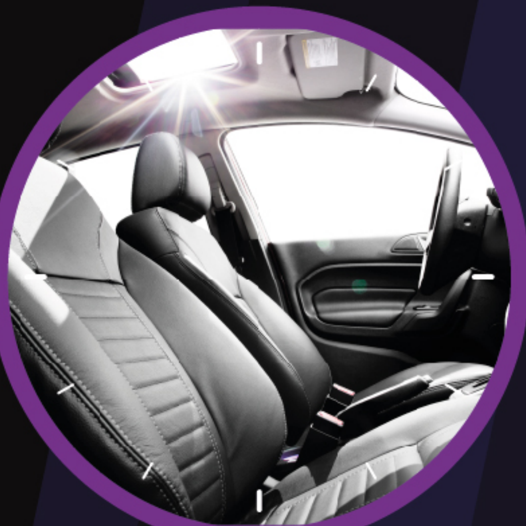
Interior versión TITANIUM

° Disponible únicamente en el FORD FIESTA TITANIUM