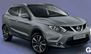
GRIS M - KAD