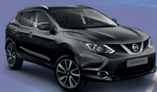
NEGRO M - Z11