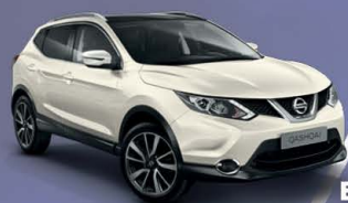
BLANCO S - 326