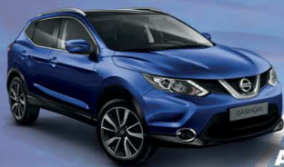
AZUL ZAFIRO M - RBN