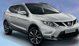
Plata M - KYO