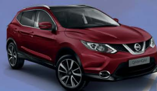
ROJO PERLADO M - NAJ