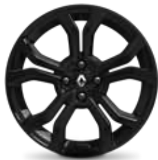
Rines de aluminio 17" Grand Prix